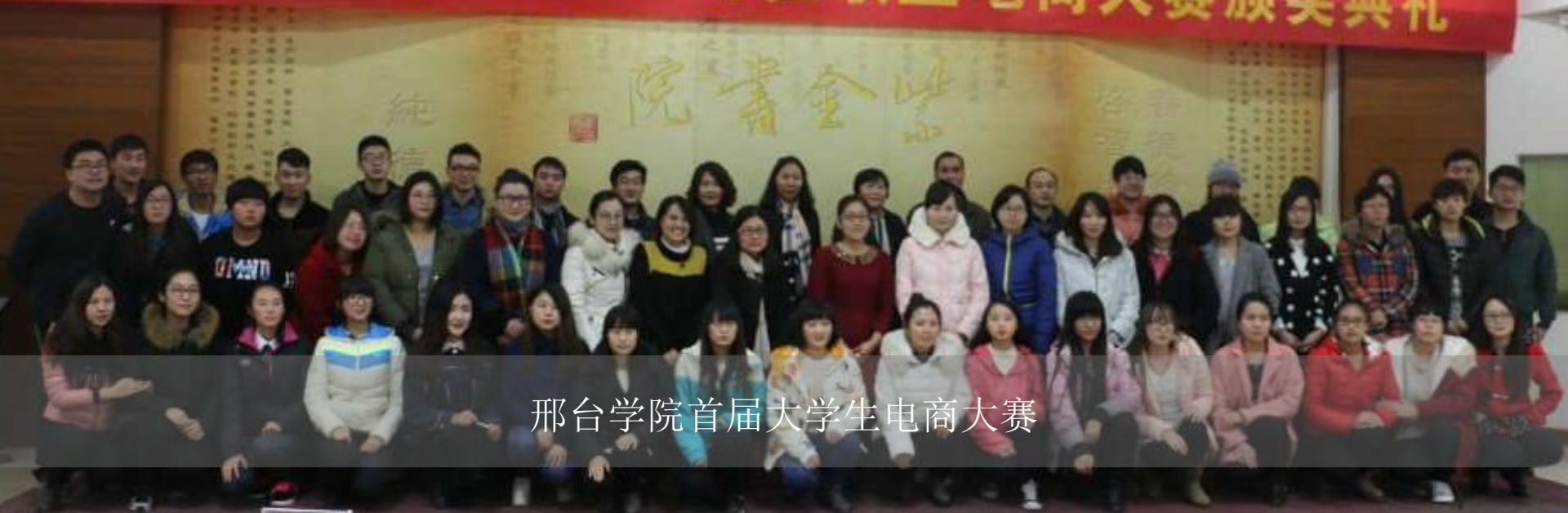
邢台学院首届大学生电商大赛