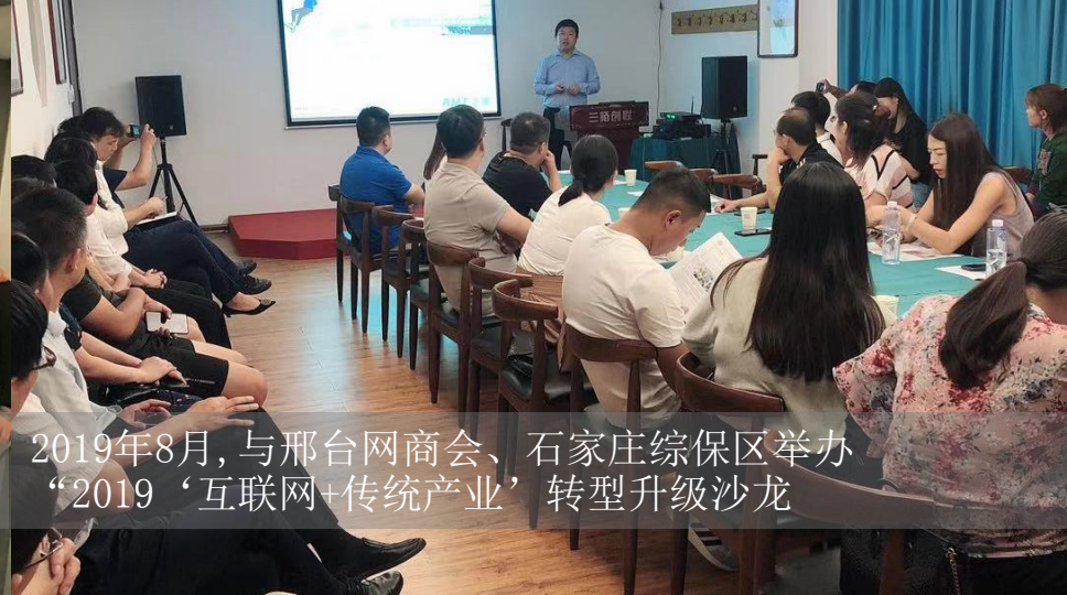
2019年8月,与邢台网商会、石家庄综保区举办 “2019‘互联网+传统产业’转型升级沙龙”