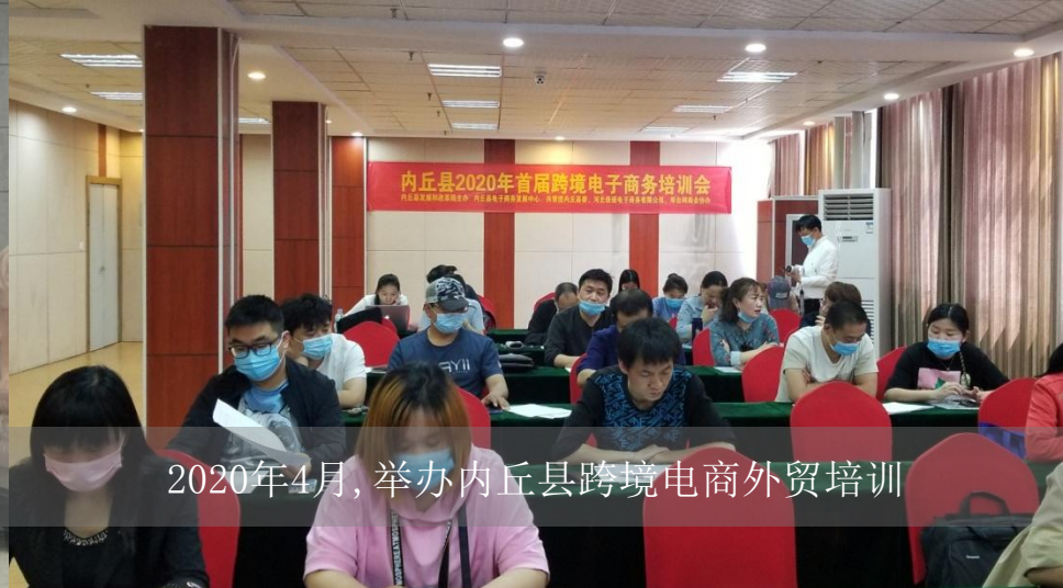
2020年4月，举办内丘县跨境电商外贸培训