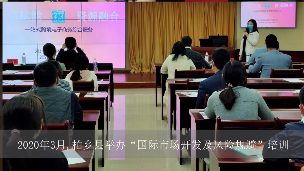
2020年3月，柏乡县举办“国际市场开发及风险规避”培训