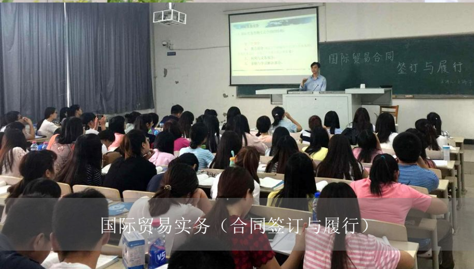
国际贸易实务（合同签订与履行）