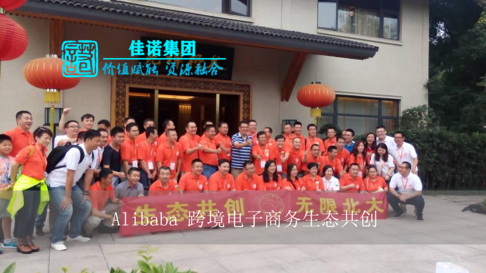
Alibaba 跨境电商生态共创