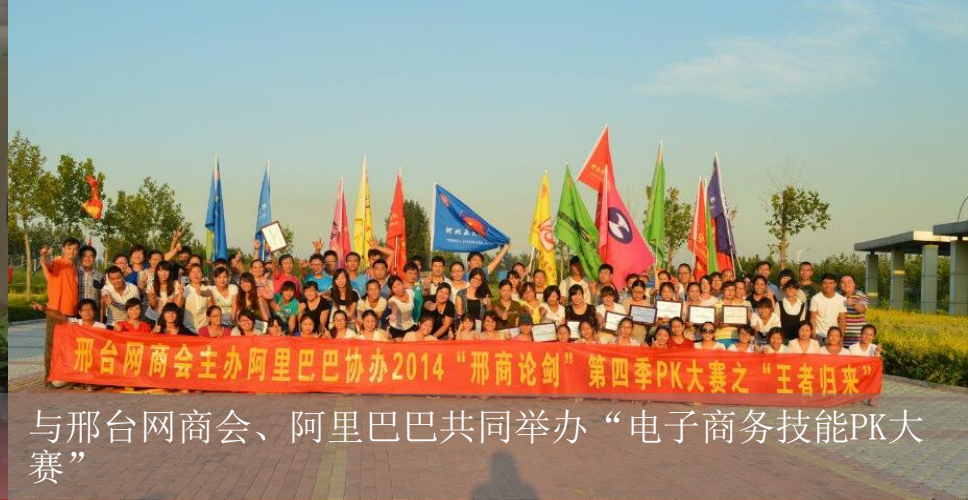
与邢台网商会、阿里巴巴共同举办“电子商务技能PK大赛”