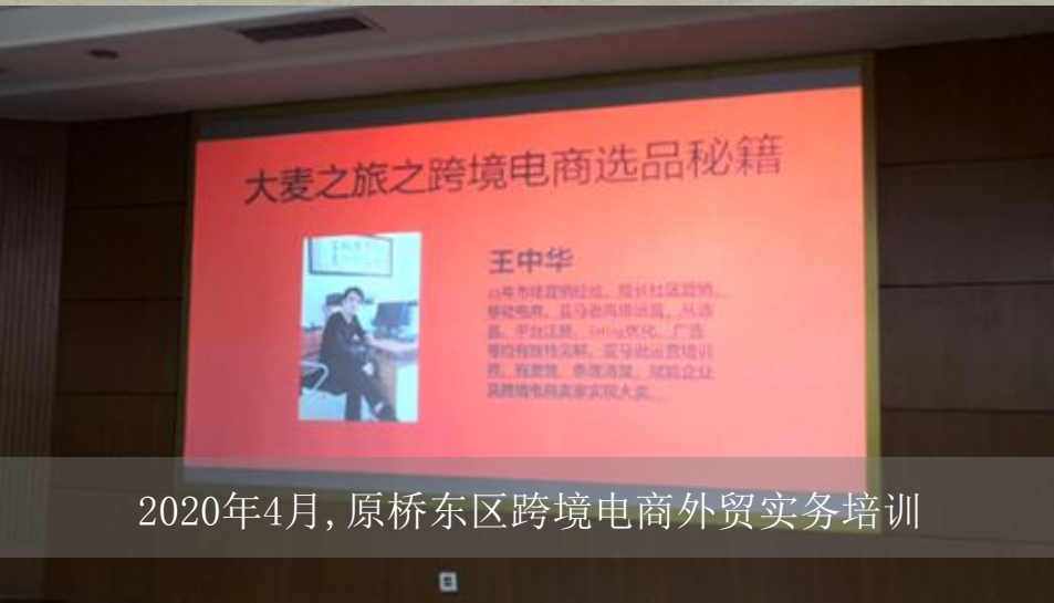
2020年4月，原桥东区跨境电商外贸实务培训