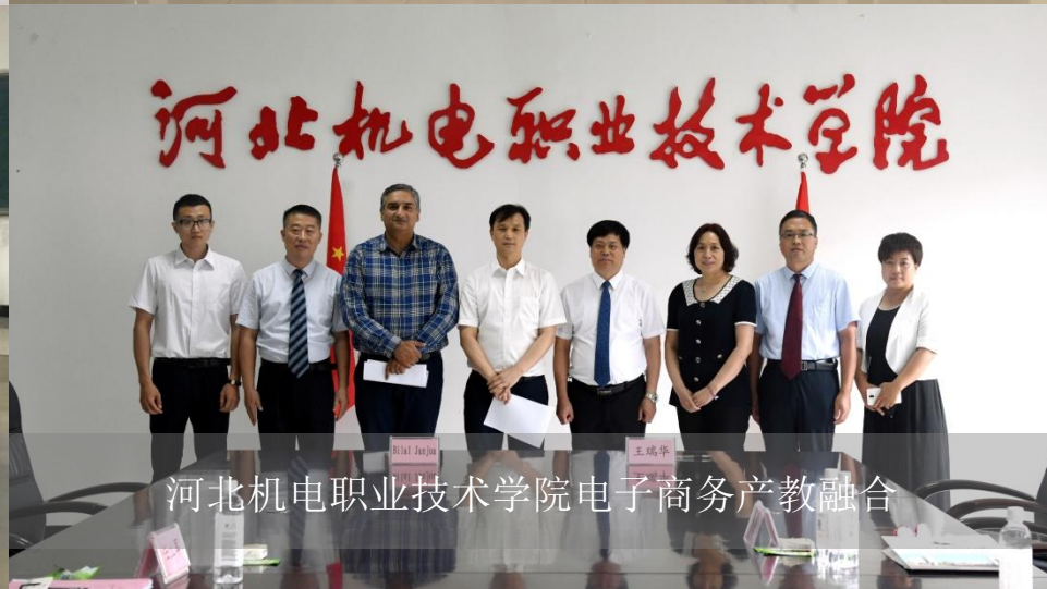
河北机电职业技术学院电子商务产教融合