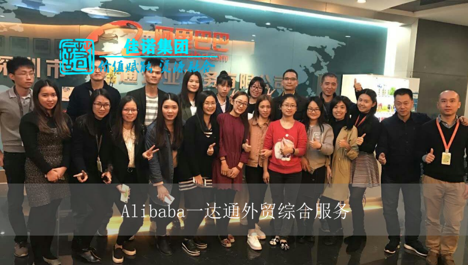
Alibaba一达通外贸综合服务