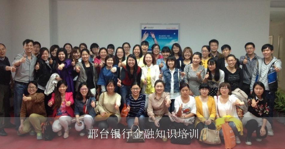
邢台银行金融知识培训