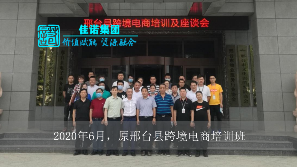
2020年6月，原邢台市跨境电商培训班